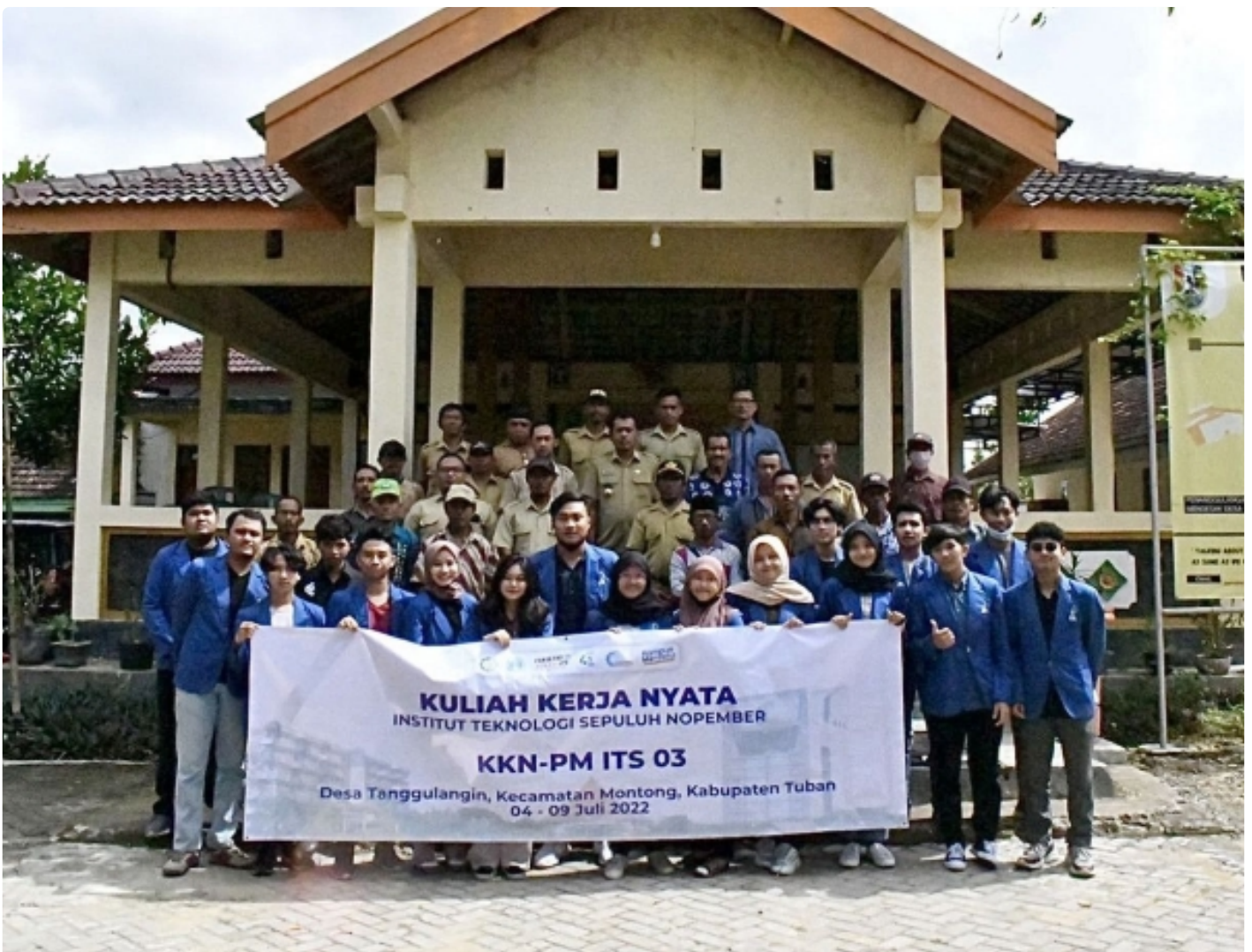
Tim Kuliah Kerja Nyata Institut Teknologi Sepuluh Nopember (ITS) berfoto bersama di Balai Desa Tanggulangin, Montong, Tuban, Jawa Timur

SURABAYA – Minimnya sistem penerangan jalan yang layak menjadi salah satu keluhan dari masyarakat Desa Tanggulangin, Montong, Tuban, Jawa