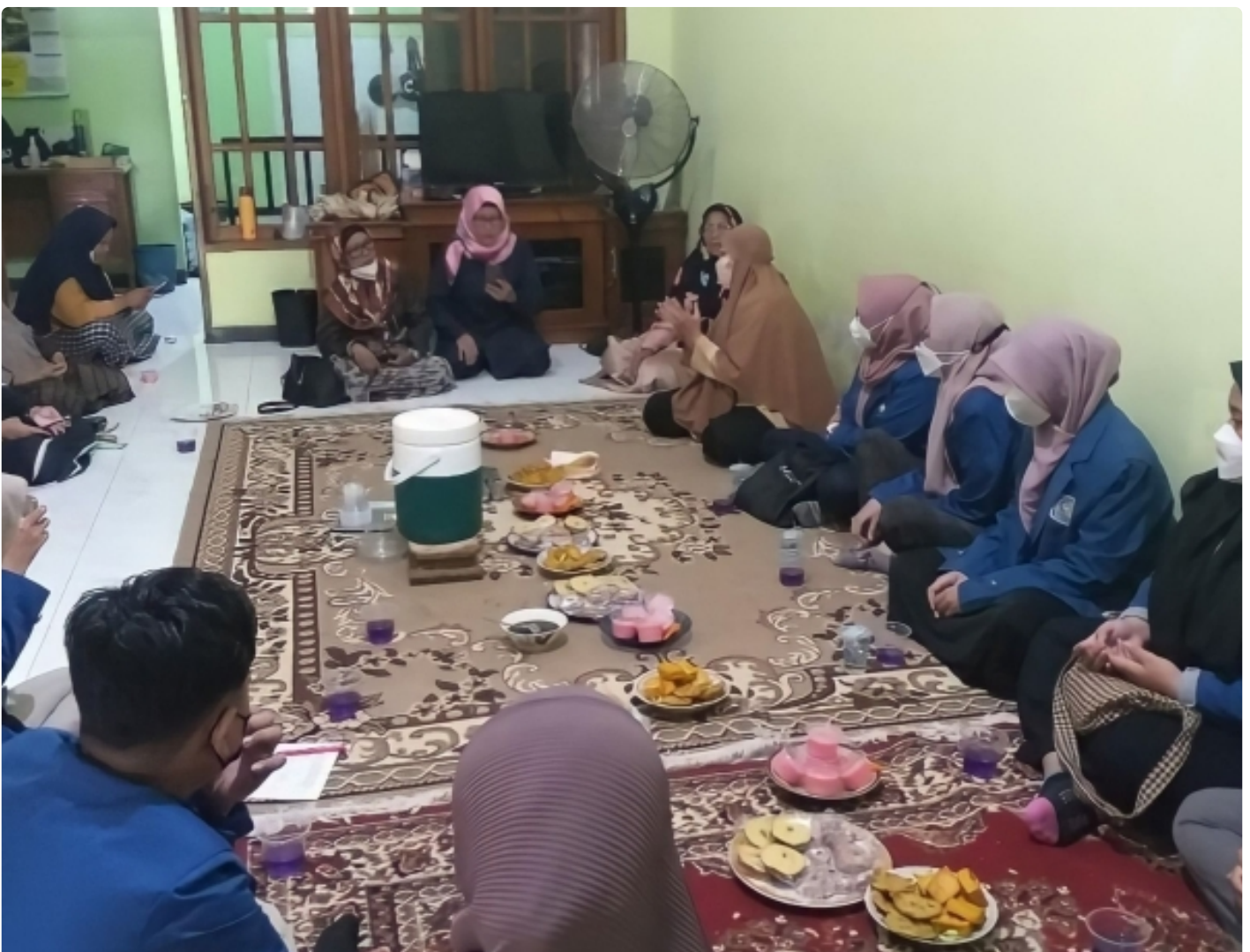
Kegiatan pendampingan dan transfer ilmu oleh tim KKN Abmas ITS kepada UMKM setempat

SURABAYA – Harga minyak goreng yang tengah membumbung tinggi di pasaran membuat sebagian pejuang ekonomi keluarga merasa terhimpit dan kewalahan. Berangkat dari permasalahan tersebut, tim Kuliah Kerja Nyata dan