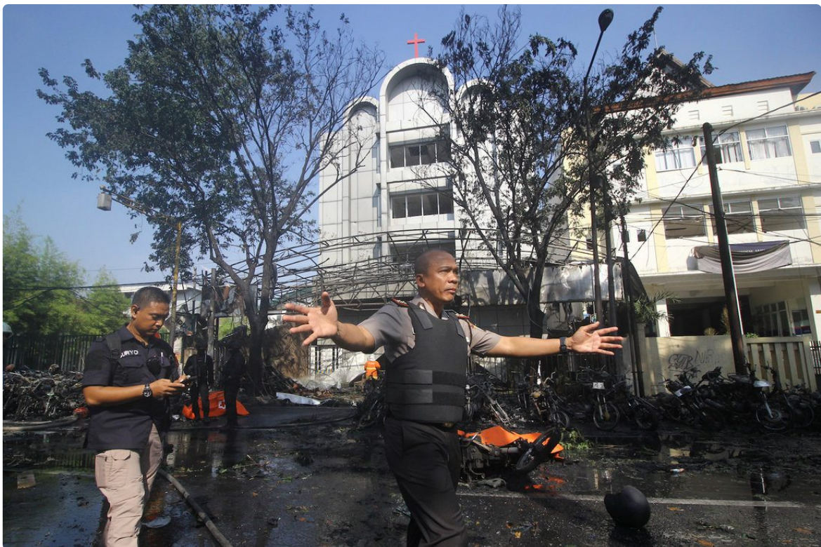
Polisi di depan Gereja Pantekosta Pusat Surabaya (GPPS), salah satu target pengeboman terorisme pada 2018. (Foto: Moch Asim ).

“Strategi kontra-terorisme yang dapat dilakukan pemerintah dalam negeri meliputi beberapa aspek,” tambah Thomas. Di sini Thomas menekankan pentingnya insentif positif. Pemerintah harus memastikan bahwa kesejahteraan ekonomi masyarakat dapat terpenuhi.