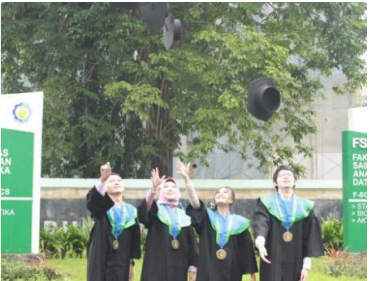
Ke empat wisudawan angkatan pertama Departemen Aktuaria ITS di depan Menara Sains, Sabtu (26/3)

SURABAYA – Departemen Aktuaria Institut Teknologi Sepuluh Nopember (ITS) yang resmi didirikan pada 2018 lalu telah meluluskan talenta-talenta terbaiknya untuk pertama kali. Aktuaria ITS telah meluluskan empat mahasiswa angkatan